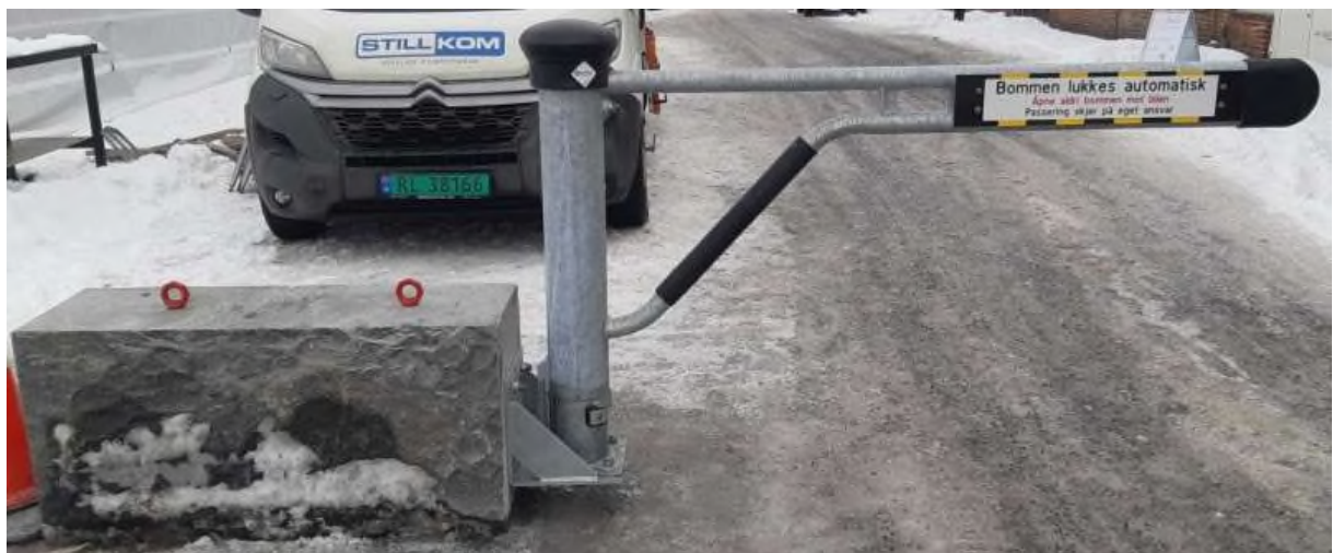
Bilde 2: Bom på granittblokk vil bli noe likt dette